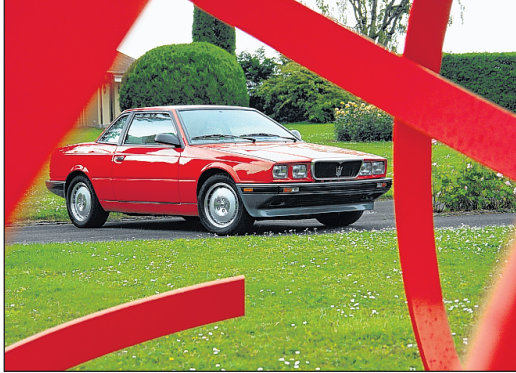
Der Maserati Karif (nur 221 Stück wurden davon hergestellt.) hinter der «Textura Grande».

50 œuvres. Le livre, qui retrace toute l’histoire du légendaire bolide et les mois de lutte pour obtenir une œuvre d’art, sera présenté lors du vernissage. Il documente comment la visite de l’atelier d’une femme extraordinaire a donné naissance à une sculpture extraordinaire et comment un véhicule extraordinaire a reçu une nouvelle vie. L’artiste Marc Reist exposera une cinquantaine d’œuvres (peintures et sculptures), des œuvres récentes et des travaux de ces dernières années qui leur correspondent. Et au cœur de l’événement se trouve bien sûr la fameuse Maserati de la maison Dürrenmatt, l’un des rares exemplaires encore en état de cette série unique. ■